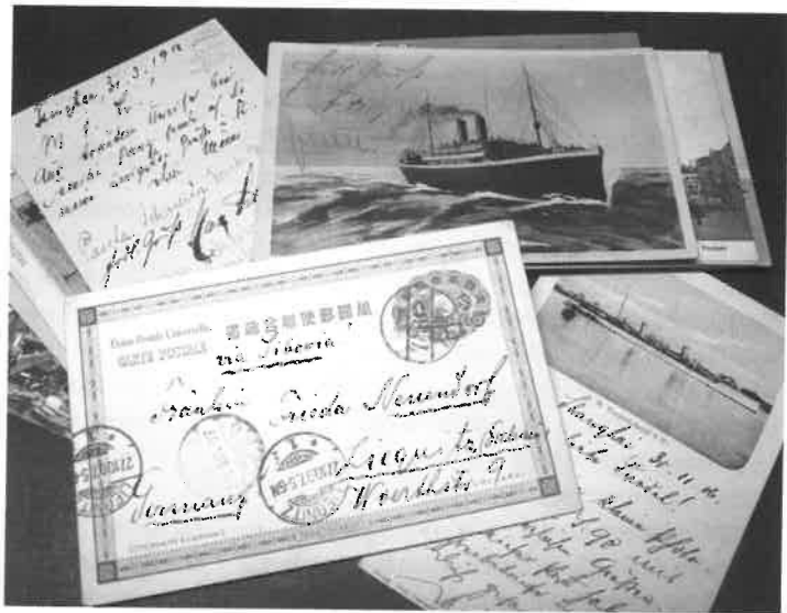
Briefe und Postkarten von Otto Schulze, 1906–1913

Die Rasanz und das Tempo, mit denen die Transkripte fertiggestellt wurden, überstiegen jede Erwartung. Die Hälfte der zum Teil mehr als 100 Seiten umfassenden Reiseberichte war bereits im Juni transkribiert. Der Einblick in die Weltanschauung um 1900, die Informationen zu den fremden Kontinenten, dramatische Ereignisse wie Schiffsunglücke oder Krankheiten an Bord wie Gelbfieber und Seekrankheit waren interessant und kurzweilig und machten das Arbeiten zum Vergnügen, was die Helferinnen und Helfer zusätzlich motivierte. Sie forderten Nachschub.