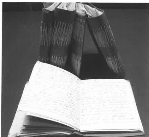
Sammlung der Briefe Otto Schulzes

Viele der beteiligten Senioren hatten sich an die Zusammenarbeit so sehr gewöhnt, dass sie dem Archiv weitere Mitarbeit anboten.