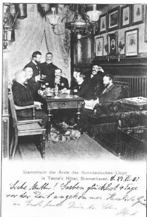
Postkarte von Alfred Abenhausen, 1902

Damit kam die Idee zur Umsetzung: Einerseits sollten engagierte Berliner Senioren gesucht werden, die mit den alten Schriften Erfahrung haben und für die die Aufarbeitung des Nachlasses von Alfred Abenhausen ein attraktives Ehrenamtsangebot sein könnte. Andererseits sollte auch dieses Projekt den oben angegebenen Beispielen folgen und mit einer aktiven Medienarbeit begleitet werden. Die Entscheidung für das passende Berliner Ehrenamtsportal unter den vielen Möglichkeiten fiel zugunsten der Stiftung „Gute Tat“. Die Zielsetzung der Stiftung ist, über das Medium Internet möglichst viele hilfsbereite Menschen mit konkreten Angeboten zusammenzubringen. Auf der Internetseite werden unter dem Motto „Engel in Berlin werden“ Ehrenamtliche an Projekte vermittelt. Die potentiellen „helfenden Engel“ können ankreuzen, ob sie sich in betreuenden, sozialen oder sportlichen Projekten engagieren wollen oder aber an Öffentlichkeitsarbeit, redaktioneller Tätigkeit, Verwaltung oder Internettätigkeiten interessiert sind. Die Liste ist lang.